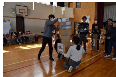
教職員との宅急便リレー