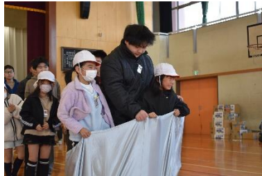
2年生とのデカパンリレー