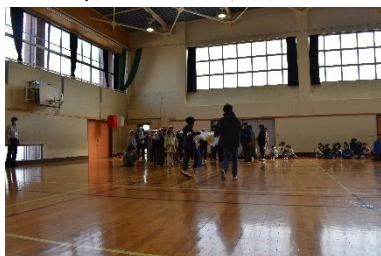
4年生とのふろしきリレー